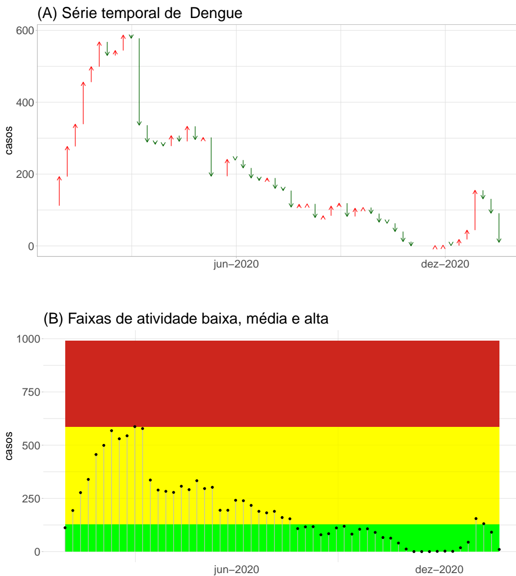
Figura 3. (A) Curva de casos de dengue indicando variação semanal; (B) Níveis de atividade pré-epidêmico (verde) e epidêmico (vermelho) .

A figura 3B mostra a curva de casos de dengue e as faixas de atenção. A faixa verde indica incidência abaixo do limiar pré-epidêmico da região. A faixa vermelha indica incidência acima do limiar epidêmico estabelecido para a cidade utilizando dados históricos. Em algumas cidades, também é apresentado, como uma linha verde, o número de casos preditos com base no ajuste de modelo estatístico a dados de redes sociais (ver Notas ).