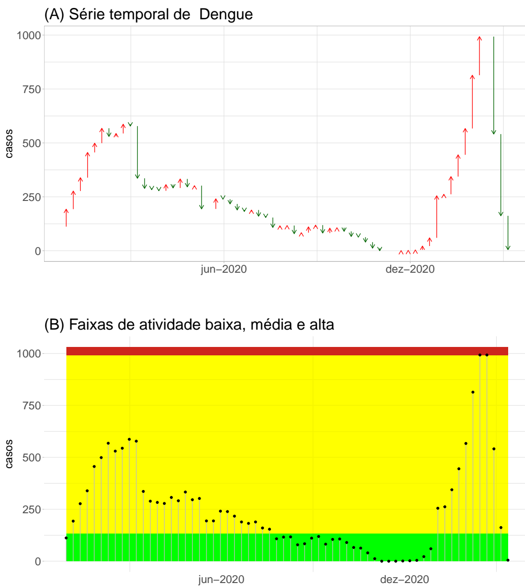
Figura 3. (A) Curva de casos de dengue indicando variação semanal; (B) Níveis de atividade pré-epidêmico (verde) e epidêmico (vermelho) .

A figura 3B mostra a curva de casos de dengue e as faixas de atenção. A faixa verde indica incidência abaixo do limiar pré-epidêmico da região. A faixa vermelha indica incidência acima do limiar epidêmico estabelecido para a cidade utilizando dados históricos. Em algumas cidades, também é apresentado, como uma linha verde, o número de casos preditos com base no ajuste de modelo estatístico a dados de redes sociais (ver Notas ).